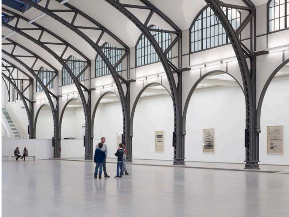
Susan Philipsz, Part File Score , 2014 24-Kanal Sound Installation, Nationalgalerie im Hamburger Bahnhof, Berlin 2014